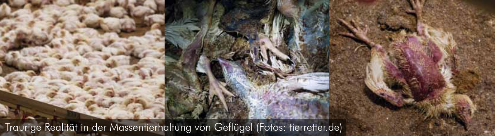
Traurige Realität in der Massentierhaltung von Geflügel

Nordhessen im Wandel: Mit dem Geflügelschlachthof Plukon in Gudensberg (wenige km südwestlich von Kassel) fing es vor gut 4 Jahren an. Allein in Gudensberg schlachtet der Betrieb des niederländischen Konzerns (1,4 Mrd. Euro Jahresumsatz) pro Jahr 36,5 Millionen Tiere!